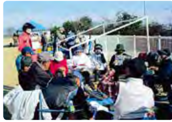
高齢者交通安全教室 (岡山東)