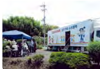
高齢者交通安全教室 (津山)