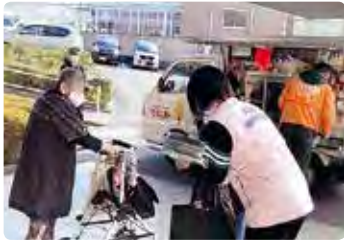
交通安全広報活動 (岡山中央)

県内各地区の交通安全協会は、皆さんの会費によって交通事故をなくすため様々な交通安全活動を行っています。活動の一例を、このコーナーで紹介します。