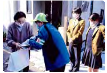
興陽高校合同独居老人宅訪問手作り弁当宅配 (岡山南)