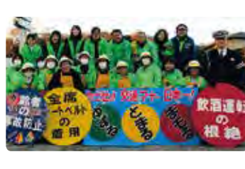
年末年始の交通安全街頭活動 (児島)