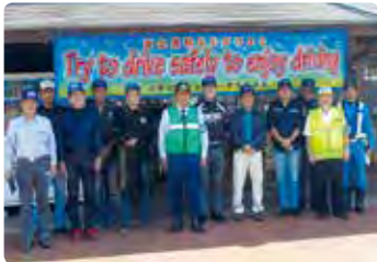
交通安全広報活動 (井原)