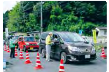
交通安全広報啓発活動 (美咲)