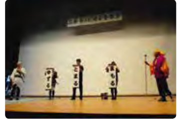
高齢者交通安全教室 (玉島)