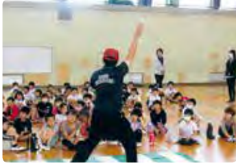
交通安全教室 (赤磐)