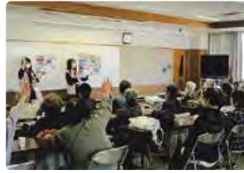
高齢者交通安全教室 (岡山西)