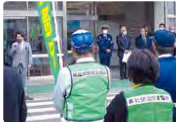
交通安全広報活動 (総社)