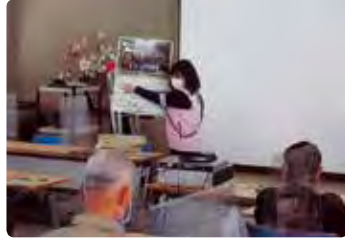
高齢者交通安全教室 (玉野)