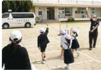
小学校での交通安全教室 (備前)