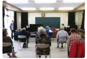
高齢者交通安全教室 (岡山北)