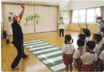
幼稚園での交通安全教室 (赤磐)