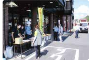
交通安全啓発活動 (玉島)