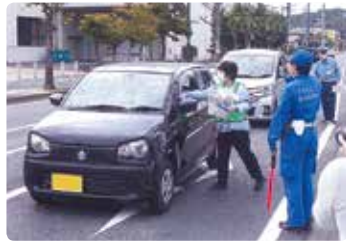
交通安全啓発活動 (総社)