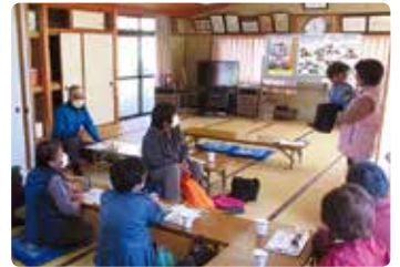
高齢者交通安全教室 (美咲)