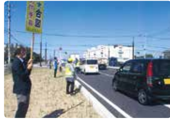
交通安全啓発活動 (岡山南)