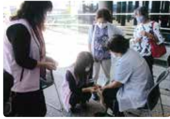
高齢者安全運転セミナー (岡山西)