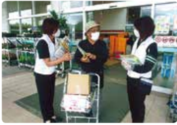
交通安全啓発活動 (岡山東)

県内各地区の交通安全協会は、皆さんの会費によって交通事故をなくすため様々な交通安全活動を行っています。活動の一例を、このコーナーで紹介します。