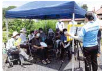
紙芝居による交通安全教室 (美作)