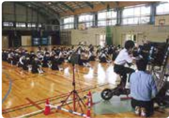
中学校での交通安全教室 (井原)