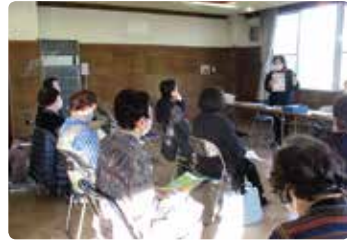
赤崎学区愛育委員年末年始の交通安全教室 (児島)