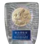
優良運転者表彰盾