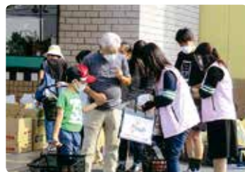
交通安全街頭活動 (岡山西)