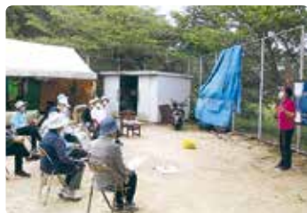
高齢者交通安全教室 (児島)