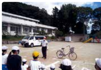
小学校交通安全教室 (真庭)