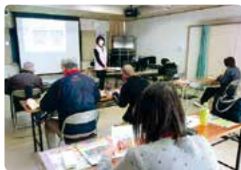
高齢者交通安全教室 (岡山東)