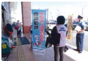
交通安全街頭活動 (岡山中央)

県内各地区の交通安全協会は、皆さんの会費によって様々な交通安全活動を行っています。その活動状況を、このコーナーで一部紹介します。