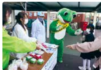
交通安全啓発活動 (玉島)