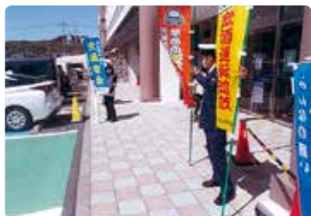
交通安全街頭活動 (玉野)