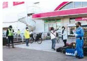
交通安全街頭活動 (瀬戸内)