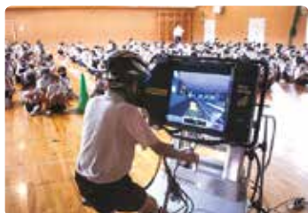
小学校交通安全教室 (井原)