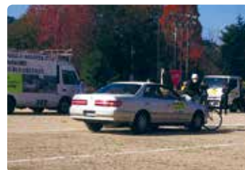
中学校交通安全指導 (美咲)