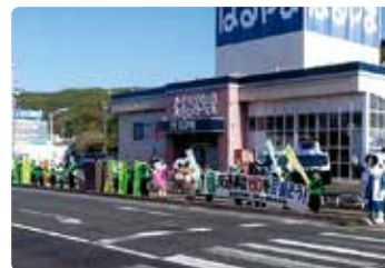
交通安全街頭活動 (笠岡)