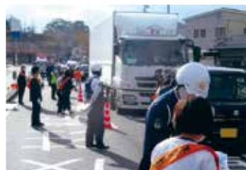
交通安全啓発活動 (津山)