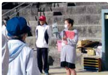
高齢者交通安全教室 (新見)