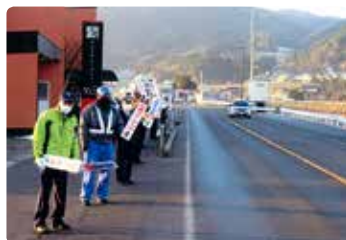
交通安全啓発活動 (津山)