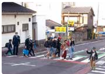
交通安全啓発活動 (岡山中央)

県内各地区の交通安全協会は、皆さんの会費によって様々な交通安全活動を行っています。その活動状況を、このコーナーで一部紹介します。