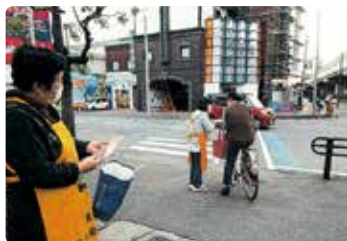
交通安全街頭活動 (倉敷)