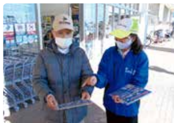
交通安全街頭活動 (岡山南)