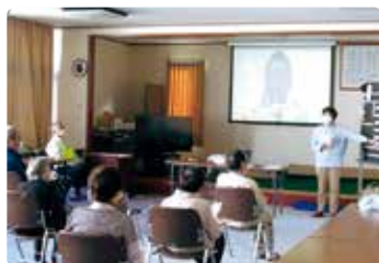
高齢者交通安全教室 (美作)