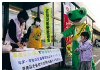
交通安全街頭活動 (玉島)