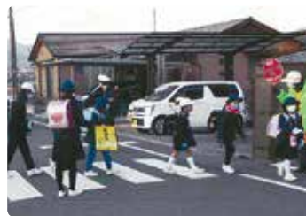
交通安全啓発活動 (児島)