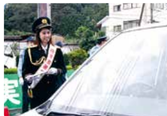
交通安全啓発活動 (美咲)