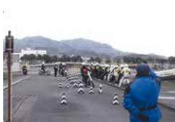
二輪車交通安全教室 (笠岡)