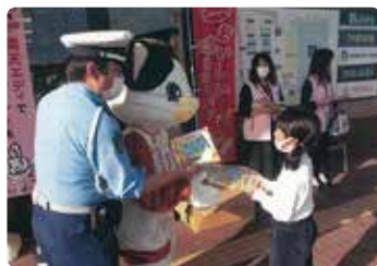
交通安全街頭活動 (岡山西)