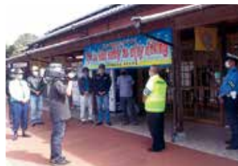
交通安全広報活動 (井原)